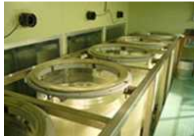
【5本のガラスタンク】

2年前から中小企業者である株式会社北雪酒造は、安心・安全・高品質な清酒への市場ニーズに対応して酒米生産を担える意欲のある前述の6戸の農家へ全面的な支援をするとともに、それらの酒米を全量購入して、大吟醸など高付加価値の清酒として製造・販売している。今般、新しい産地消費者交流型市場を開拓するため、「俺の酒」として内外の消費者からのオーダーメイドの酒づくりに挑戦するため、本事業を着手するに至った。