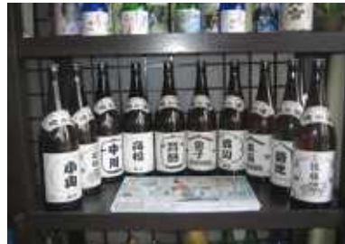
【オーダーメイドの酒の例】

本製品は、業界初となる「朱鷺と暮らす郷づくり認証米」づくりからこだわったフルオーダー清酒である。そのため、直接競合する商品は見当たらない。酒米からほ場・生産農家までの酒米栽培履歴の証明を可能にし、健康志向の消費者をも満足させることが出来るという特徴がある。また、オーダーメイドの「俺の酒」(種別、アルコール分、ラベル、納期を選択できる)として仕込みむことを可能にしている。さらに、顧客の個別嗜好に対応できる小ロットな受注生産が可能である。