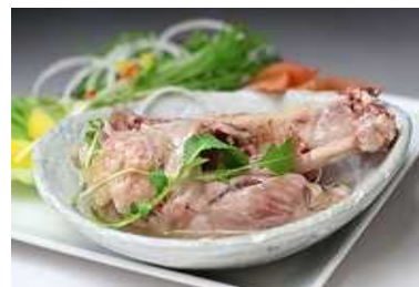
アيسバイン(骨付き豚すね肉の塩漬け)

「つくば豚」は、遺伝子測定技術を利用した、今までにない全く新たな豚である。消費者に好まれる、適性脂肪含有量を持つ豚のみを肥育・販売していくので、商品の当たり外れがなく、消費者の期待に背くようなことがない。また、つくば市とその周辺地域の畜産業者とともに本計画に取り組んでいくことによって、トレーサビリティを含めた安全性と地域性を両立した、積極的なブランド構築を実現し、全国的な需要開拓を図っていく。