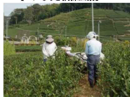
【べにふうき摘採風景】

やまと興業(株)は、各種緑茶やべにふうき茶の粉末製品の製造・販売をしており、その中で茶葉の生産者である(有)ネクトのシーマ製法によるべにふうきを使用し、メチル化カテキンなどの機能性成分を有する、「ガム食感菓子」を商品化することになった。 商品の製造は、明治薬品(株)が独自に開発した製法で作られ、3社の特色の融合が図られる。