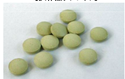
【試作品タブレット】

シーマ製法による、苦みや渋みのないまるやかなべにふうき茶を、0.2~0.5ミクロンの超微粒子粉末にし、ザラツキのないタブレット状ガム食感の菓子となり、噛んでいるうちに成分が溶出する。 このように超微粒子粉末をそのまま含有した商品は他にない。 その他、口腔衛生・ブレスケアへの期待も高く、健康食品やサプリメント市場への開拓を行なっていく。