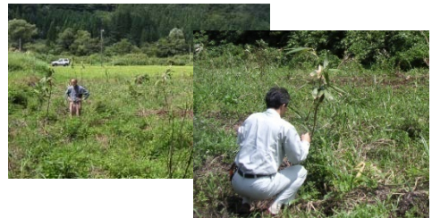
<耕作放棄地とネマガリタケ試験栽培>