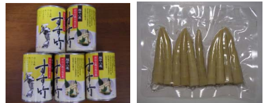
<ネマガリタケ缶詰(現商品)とレトルト試作品>

八尾産のネマガリタケは、味、香り、食感等に優れ、また、新製法のレトルト加工することにより、長期間保存可能な食材となる。現在国内で消費されるネマガリタケの約9割は中国からの輸入品であり、安心な国産のニーズが高まっている。また、9割近くが耕作放棄地となっている八尾の中山間地における農業活性化にもつながる。