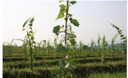
ワイン用ブドウの栽培状況

(株)T-marksは耕作放棄地を利用してブドウを栽培しワイン醸造する事業を企画し、地域の有力な魚問屋である(株)釣屋魚問屋が、肥料用の魚粉とワインにあった魚料理を提供することとした。さらに魚粉は廃棄されていた雑魚を有効利用することとし、それを(有)日の出大敷の定置網に求めることとした。新製品の販売には大手デパート等へ固有のチャンネルを構築している(有)シーフード北陸と連携することにより事業の推進力が増したものである。