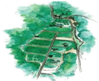
ワイナリーイメージ図

従来は価値がないため廃棄されてきた雑魚を肥料に加工し、ワイン用ブドウの栽培に役立てる。地域ブランドである魚を活かして、新たに醸造したワインに合う料理や新製品を開発することで、ワインを新たな氷見ブランドとすることで、今まで以上に域外からの集客効果が高まり、地域経済活性化にもつながるものである。