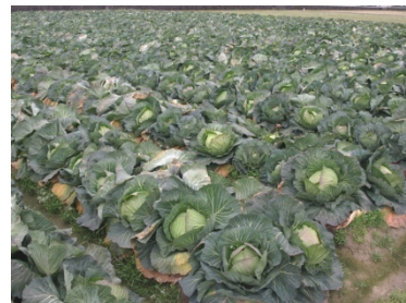
(有)くらた農産のキャベツ畑

(株)セイツーは、安心・安全な野菜を手軽で簡単にたくさん食べていただくため、過熱加工したスチーム・ベジタブルの製造・販売を計画。一方、商品開発には、品質が高く安心・安全な国産野菜が欠かせないが、従来から、「土づくり」の指導と取引を行っており、生産する野菜の品質の高さを認識していた(有)くらた農産と、連携を開始した。