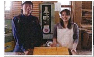
ブライダル手作りサービス

(有)木工房蔵は、木目を生かした三連時計を開発し、結婚式・披露宴での両親へのプレゼントとして人気商品になっている。この商品を販売する中で、結婚式・披露宴にかかわる商品を手作りしたいという要望が多く寄せられたため、木製の新たなブライダルギフトの開発・提供と多店舗展開を検討していた。一方、武生森林組合は、越前スギをはじめとする良質な木材を有しているものの、木材需要や森林整備をとりまく環境が変化する中で、間伐材の販路開拓が急務であった。(有)木工房蔵が必要とする木材は間伐材で対応できることから、両者の思いが一致し、連携して本事業に取り組むこととなった。