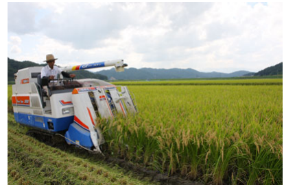
<「フクノハナ」稲刈り>

酒造メーカーである(株)福光屋はお米の醱酵技術を応用したノンアルコール醱酵食品の製造・販売を計画。商品開発には、品質が高く安心・安全な酒米が欠かせないことから、従来から、兵庫県豊岡市出石町だけで生産されている酒米「フクノハナ」を使用した純米酒「コウノトリの贈り物」の製造で連携しているたじま農業協同組合と本事業を開始した。