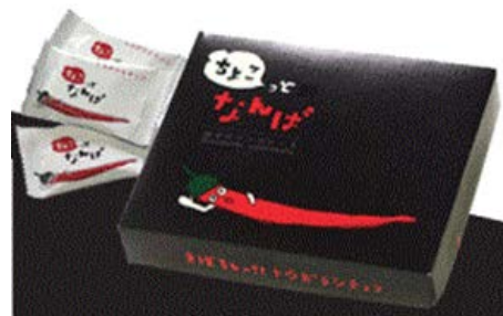
剣崎なんばを活用したチョコレート

(株)Anteの主力商品であるサイダーやゼリーは夏季を中心とした商品のため、冬季向け商品の開発が課題であった。一方、剣崎なんば生産組合では、一味唐辛子等の既存商品以外にも、唐辛子を活用したスナック菓子など新たな商品開発や、未利用となっていた完熟前の青色の唐辛子の有効利用を模索していた。このような経緯において、両者が連携して、唐辛子を活用したチョコレートの等の各種商品を開発・販売することとなった。