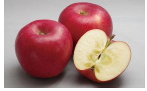
(プレザーブ試作品)