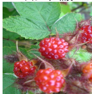
ワインベリー果実

(有)末廣軒は食べ歩き用商品、土産物用商品とターゲットに応じた「ワインベリースイーツ」を開発。また、ワインベリーのストーリー化やブランド化を図り、新規顧客の開拓を目指す。