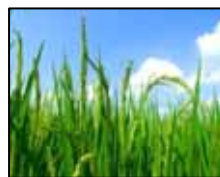
豊かな自然で栽培された農産物

(有)援農甲立ファームは、介護食用の食材である「米」「野菜」「薬草」等の栽培・生産に当たり減農薬栽培等、安芸高田アグリフーズ(株)が要求する基準に基づき生産を行い、更に生産履歴を明確にすることで安全性を確保する。農産物は全て安芸高田アグリフーズ(株)が買い取り、「凍結含浸法」と呼ばれる食品加工技術を用いて、付加価値の高い介護食を製造する。素材の姿はそのままで嚙まずに食べるのできる「嚙下食」と材料と調理方法にこだわった「薬膳がゆ」を柱に展開を行う。少子高齢社会の到来により、今後、介護食市場は益々拡大すると考えられる。