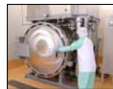
高温低温真空調理システム