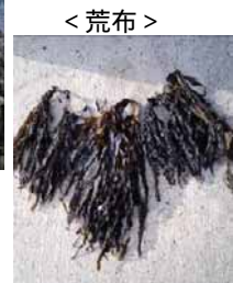
< 荒布 >