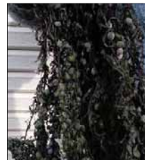
< 神葉 >