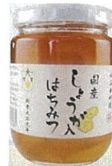
【国産しょうが入はちみつ】

国産ハチミツが主役の商品を開発するため、両者は協力してレシピ開発、消費者による評価を繰り返し、配合比率の検証を実施した。幾度の試作・試飲・改良等を経て、ハチミツの風味、ショウガの風味ともにバランスの良いレシピを完成させ、国産ブランドをコンセプトとした商品製造に至った。このレシピを実現するために、(株)ハマノでは、果肉の食感の良い新ショウガを入手し温度や加工時間を管理し鮮度を保持して加工するほか、ハチミツの混合・攪拌・濃縮工程においても、高温によるハチミツの劣化を防ぐため、低温で濃縮することにより風味を維持する。一方、水谷養蜂園(株)でも、希釈飲料として商品価値を高めるため、精製工程において未利用ハチミツの味や香りのクセをとり、タンパク質を除去することで水に溶解しやすい原料の提供を行う。