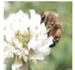
【採蜜するミツバチ】