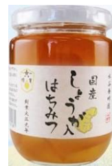
【国産しょうが入はちみつ】

国産ハチミツが主役の商品を開発するため、両者は協力してレシピ開発、消費者による評価を繰り返し、配合比率の検証を実施した。幾度の試作・試飲・改良等を経て、ハチミツの風味、ショウガの風味ともにバランスの良いレシピを完成させ、国産ブランドをコンセプトとした商品製造に至った。このレシピを実現するために、(株)ハマノでは、果肉の食感の良い新ショウガを入手し温度や加工時間を管理し鮮度を保持して加工するほか、ハチミツの混合・攪拌・濃縮工程においても、高温によるハチミツの劣化を防ぐため、低温で濃縮することにより風味を維持する。一方、水谷養蜂園(株)でも、希釈飲料として商品価値を高めるため、精製工程において未利用ハチミツの味や香りのクセをとり、タンパク質を除去することで水に溶解しやすい原料の提供を行う。