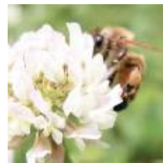
【ミツバチと巣箱】 【採蜜するミツバチ】