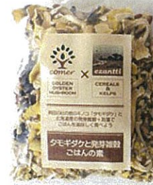
【タモギタケと発芽雑穀のごはんの素】

(株)中部タモギタケは、タモギタケ菌床栽培特許をもとに栽培を行っていたが、生のタモギタケでは消費期限が短く生産コストに見合った販路確保が難しいという販売面での課題が発生した。そこで、(株)Japan Food Expertからの提案で、乾燥機を導入し常温で長期保存が可能な乾燥形態の商品を製造しタモギタケの品質向上・安定供給を実現し、廃棄率低減を可能にした。一方、(株)Japan Food Expertは、乾燥タモギタケに国産発芽雑穀を調合レシピを開発する等、加工食品を主体的に企画・展開し、乾燥タモギタケの加工食品を商品化することで、既存販路に加えて新たな市場へ販路開拓を図る。