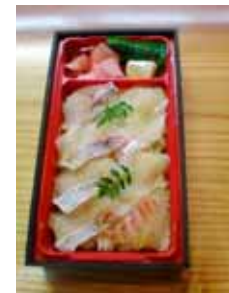
タイ昆布じめ寿司

本事業の商品は、天然の好漁場を活かし、適正給餌や環境配慮型養殖から生まれる「マダイ」「ブリ」を活用、昆布じめ寿司(マダイ)、漬け寿司(ブリ)の事業展開を図る。魚を「しめ」の際に、酢を使用しないことから酢独特の臭いや変色の無い昆布じめを実現した。さらに、消費者のニーズに対応して消費期限を伸ばすことにより利便性向上を目指すとともに、冷凍寿司や魚の加工食品などの開発を進める。