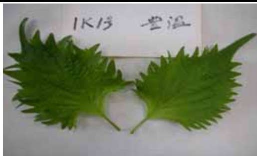
新品種「愛経1号」(左側)と市販品(右側)

豊橋温室園芸農業協同組合は愛知県農業総合試験場が開発した新品種の青じそ「愛経1号」を栽培、同研究会のメンバーでペースト状に加工する技術を有する(株)T.M.Lとよはしと地域に根ざした豆腐を製造する(株)寺部食品と連携して事業化を図る。