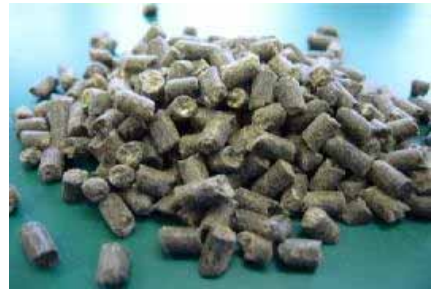
ペレット化した有機肥料

有機肥料は、食の安全等の見地や岐阜県が推進する化学肥料等を削減した「ぎふクリーン農業」等からニーズが高まっている。こうした中、本有機肥料は、鶏糞とおからを完全発酵した肥料を製造・販売する事業。生産する有機肥料は、作物ごとに必要な栄養素が混合され、ペレット化することにより肥効が長時間維持することを可能とした。また、地域の種苗事業者や地元農業協同組合等のニーズを収集し、最適な肥料成分を有する有機肥料の生産に取り組む。