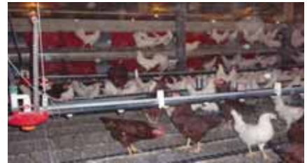
和田ファーム 鶏舎内