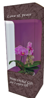
【ミディ胡蝶蘭】寸法:約30cm 【ミニ胡蝶蘭】寸法:約18cm