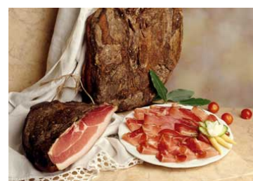
サルーミ(イタリア料理)