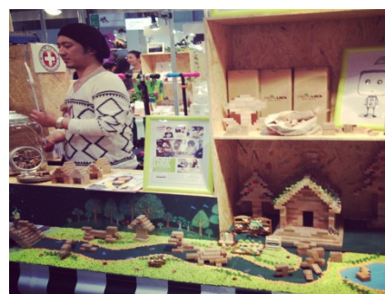
【新開発商品の展示イメージ】