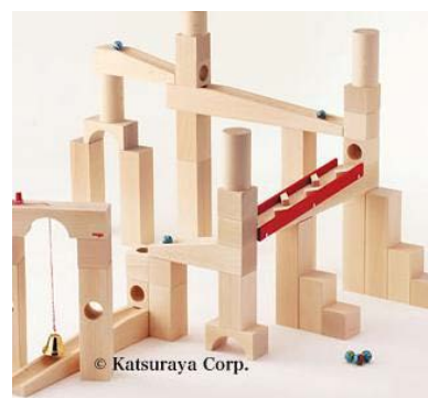
【新開発商品のイメージ】