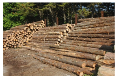
【小径木の青森ヒバ】

芯を持つことによって更に耐久性が増した土台材であり、在庫が可能となること、しかも大径木の商品より安価であることから、製品は、他の競合品、類似品と比べても競争力がある。