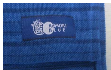
「あおり藍 AOMORI BLUE」タグ