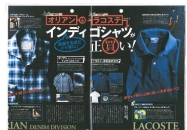
アパレルブランドとのコラボレーション例