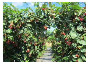
【ブラックベリー畑】

青森市の地域産業資源である「ブラックベリー」などのベリー類は豊かな色彩や酸味と甘味が微妙に絡んだ食味から年々人気が高まっている。その中でもブラックベリーの種子には老化を抑制し、がん細胞の増殖を抑える効果がある「エラグ酸」が多く含まれているが、生果は日持ちしないため、保存のためには冷凍が不可欠である。本事業では解凍時にドリップの出ない独自の方法による冷凍生果、ピューレ、アイスクリーム等を開発、製造、販売する。