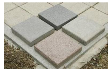
活性アルミナを添加した舗装ブロック(試作品)