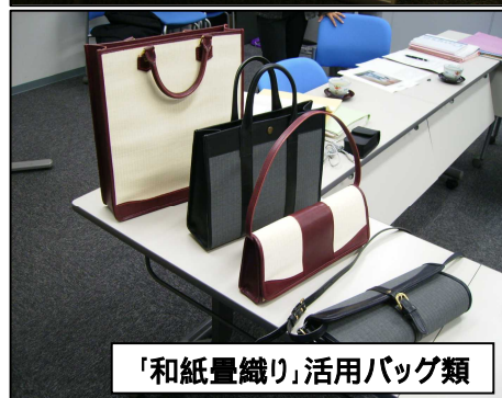
「和紙畳織り」活用バッグ類