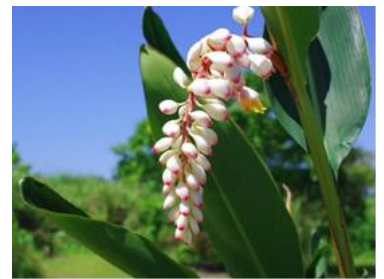
【 月桃(生花) 】

沖縄に自生する月桃の活用は、そのほとんどが葉部で、全体の80%を占める茎部は固くて加工向きではない。今回茎部を粉末化する技術を確認したことから、牛糞堆肥と月桃粉末を混合し、新たな堆肥の開発を実施する。