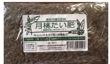
【 商品: 月桃たい肥 】