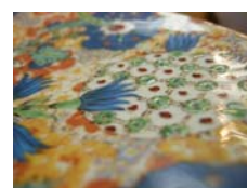
洋服をまとったような柄の カップ&ソーサー