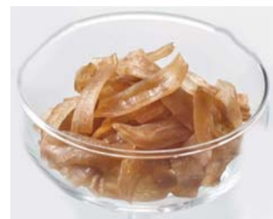
加工品：おつまみこんにゃく