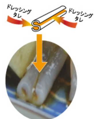
素材品：サラダこんにゃく

展示商談会へ積極的に参加し新たな食材の販路拡大を行う。販路拡大先は商社・スーパー百貨店・SA・業務用をターゲットとし5年後に海外展開を見据えた展示会に参加する。