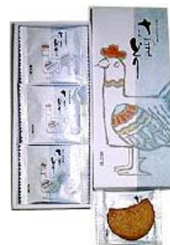
(同社のさつま鶏サブレ)