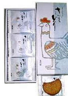
(同社のさつま鶏サブレ)