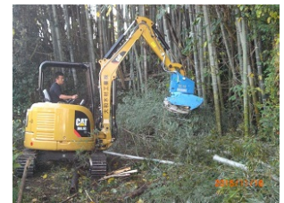
【地域産業資源：竹】 (孟宗竹の伐採)

地域産業資源である竹を、里山を中心に伐採、チップ化し、乳酸菌発酵させて、飼料・肥料のいずれにも使用できる商品「笹サイレージ」の開発・販売に取り組む。利用価値の高い飼料・肥料を開発し、生産・販売することで、国内トップクラスにある宮崎県の農業者の経営に寄与するとともに、竹林整備の推進や雇用の確保により、地域経済の活性化を推進する新たなモデルの構築を目指す。