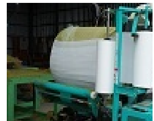
【ロール化し40日発酵】

当社の立地する都城市及び周辺地域は、わが国有数の畜産業や農業が集積していることから、飼料及び肥料の市場の需要はかなり存在する。また、当社は畜産敷料チップの大口納入先が多数あることから、開発する新商品の販路は十分に見込まれる。