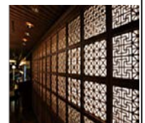
【JRななつ星・車内組子内装】