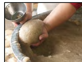
地域産業資源 【手ごねこんにやく】

また、歯ごたえや臭みの少なさという性質を利用して、サラダや和菓子にも活用できる食材を製造販売するもので、「糖質制限・グルテンフリー」というテーマでブランド化を図ることで認知度が高まり、また海外展開を行うことで地域への波及効果が期待される。