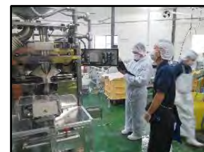
製造工程 【専用成型機の使用】

糖質制限・グルテンフリー市場の需要は、生活習慣病・ダイエットなどを背景として、健康志向の若い女性や中高年層を中心に、需要が伸びるとされており、本事業の製品は、食材としての活用という観点からの訴求力も有ることから、開発する新商品の市場性はあると見込まれる。