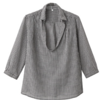
接触冷感効果のある生地を使用した製品