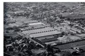
【昭和45年当時のオザワ繊維(株)】

・播州産地の伝統的織・染技術と近代的ハイテク技術の融合により、綿100%であるにも拘らずシルクのような柔らかい肌触りと高級感のある光沢が特徴の生地「パーリーコットン」、裏表の色の全く違う両面使いの今までにない薄地織物「オルタネイティブジャカード」の開発を行う。