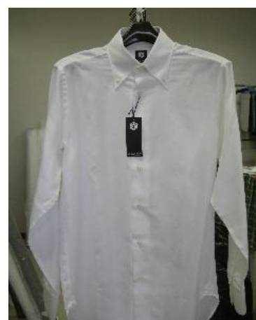
【パーリーコットン製品】