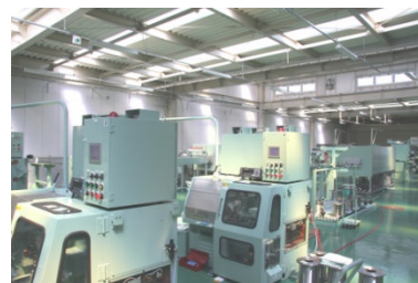
【新設した伸線工場】

・当社既存販路を活用して食品・医薬品メーカー向けの販売を行うとともに、開発した高機能ステンレス金網の新たな用途開発と新規顧客の開拓に取り組む。