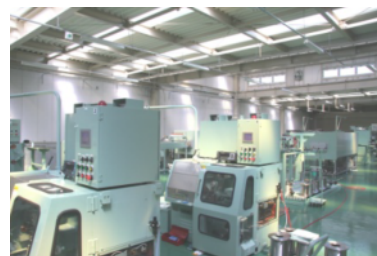
【新設した伸線工場】