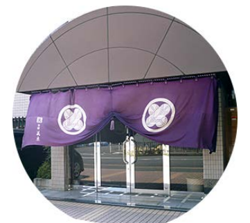
【本社（京都市中京区）】