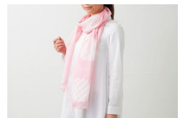
【デジタル3D絞スカーフ】