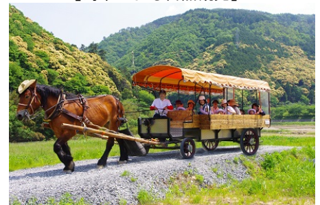
【馬車による自然観光】