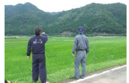
【丹波地区での生産者との打ち合わせ】