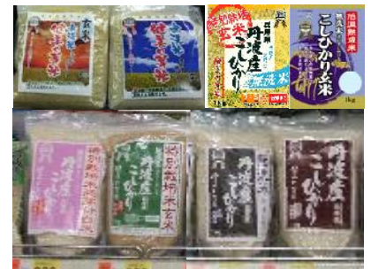
【健美の芽米・売り場】