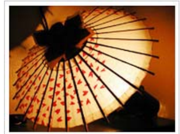
【ミニ和傘照明「古都のあかり」】