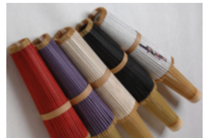
【和風照明「古都里-KOTORI」をたたんだ形】