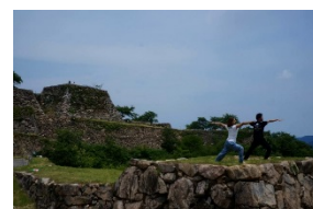
【竹田城跡ヨガ体験】

旅行市場は、体験型などのニューツーリズムが市場を伸ばしている。そのうち働く女性層を中心に「健康」や「美容」「心身浄化」などで訴求する「ウェルネスツーリズム」や「トリートメントツーリズム」の需要が伸びており、本事業の役務は、これらの魅力を有し、また訴求力も有ることから市場性はあると見込まれる。