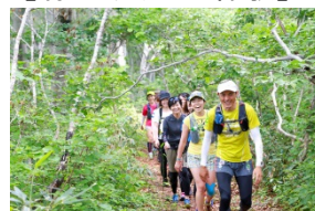
【パワースポ・トレック】

ヘルスやウエルネスなどのコンセプトで訴求する国内旅行市場を主な販売ターゲットとし、健康志向や自然派志向の大人の女性や中高年、さらにはインバウンド向けにメディアを使った販売ルートでの新たな需要の開拓を行う。