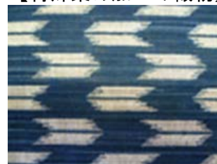
【特殊染め加工の織物】

ニーズが底堅い意匠性と希少性の高い日本の伝統織物の生産を、手加工から機械加工へと移行させ、機械生産メリットによる市場価格に沿った織物や製品化を実現している。また、日本固有の天然系染色原料の機能性(抗菌、防腐、防水、防虫)を活かした糸染め織物や、天然材料(花・野菜など)で糸染めした織物などで、日本の伝統技術を継承する織物として新たな市場開拓に繋げる。