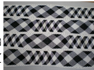
【柄の密度や生地幅を変えられる】

トーションレースが国内ブランド、海外ブランドへの需要の拡大することで、日本の繊維業界全体の発展に貢献する。