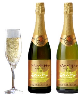
ノンアルコール発泡ワイン(イメージ)

今回開発する商品は、大手メーカーが製造する飲料や調味料、水菓子などと比較すると価格的に1割程度高くなる。しかし、世界的にもほとんど類を見ない商品であり、カエデ糖樹液が持つ特性や、秩父で収穫される果物や秩父で生産されるワインなどの醸造メーカーなどと連携することで新しいコンセプトの商品として独自色を打ち出し、価格競争を回避することは可能である。又、試作段階で各業態のバイヤーからも高評価を得ている。