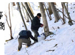
秩父樹液生産協同組合による樹液の採取

カエデ樹液原液はもちろんのこと、他の原材料の調達及び飲料や菓子、調味料等の加工もほとんど秩父地域内の事業者との連携で行い、カエデ糖樹液を活用した商品という新しい地場産食材が供給されることで、地域の飲食店や菓子店のメニューや名物が増え、地域経済の活性化が期待できる。また、秩父地域おもてなし公社、秩父商工会議所、秩父樹液生産協同組合、NPO秩父百年の森、埼玉県中小企業団体中央会及び地域事業者と「カエデ糖樹液=秩父」のブランド化を進めることにより林業、農業、食品加工業、土産品・観光産業をはじめとした地域一帯の活性化に貢献する。