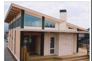
【建築外被材】 外壁材

信州カラマツ材による製品の特性は、他の針葉樹に比べ木材強度が高い。木材硬度が高く、床面使用における耐摩性能に優れる。大径木化した信州カラマツ材の比重は他の針葉樹に比べ高く、防耐火性能が高い。本事業で開発される商品は、これらの特性を活かした信州カラマツ外構部材製品、信州カラマツ材の外構商品、信州カラマツ材の建築外被材、付加価値のある木製製品用木材である。