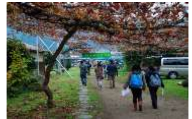
【「ワインツーリズムやまなし」の様子】