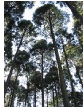
【自然落枝しやすいサンブスギ】

サンブスギは千葉県で生まれた、枝は細く、枯れ上がりが早く自然落枝しやすい挿し木スギである。そのため、端材の表面は節が少なくなめらかで美しいという特徴がある。本事業では、弊社独自の「木なり(台形形状)」製材法を活かし、未利用であったサンブスギの皮付きの端材を亀山温泉ホテルの温泉水に浸漬した後、皮むきをすることにより、独特の色と光沢と味わいを持った内装材を開発し販売する。「面皮の丸みと色つやを活かした住宅内装材」「浮造り加工を施した住宅内装材」「絞り丸太加工を施した住宅内装材」の3種類の商品を開発し、腰板等としての活用を図る。