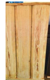
【浮造り加工を施した住宅内装材試作品】